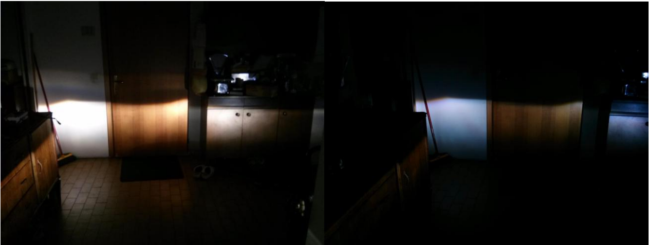
VISIONE KIT XENO REPERIBILI ON-LINE E SU EBAY

"Se volete convertire i fari della vostra auto con un kit xenon, rivolgetevi a dei professionisti e lasciate perdere i kit a basso costo, sono soldi buttati, e non scherzo."