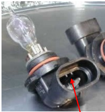
HIR 1 con 2 lamelle