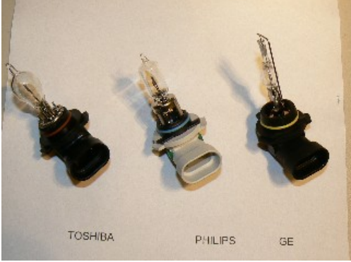
HIR installate in primo impianto