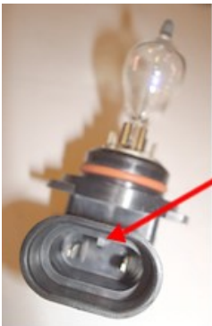
HIR 2 con 1 lamella